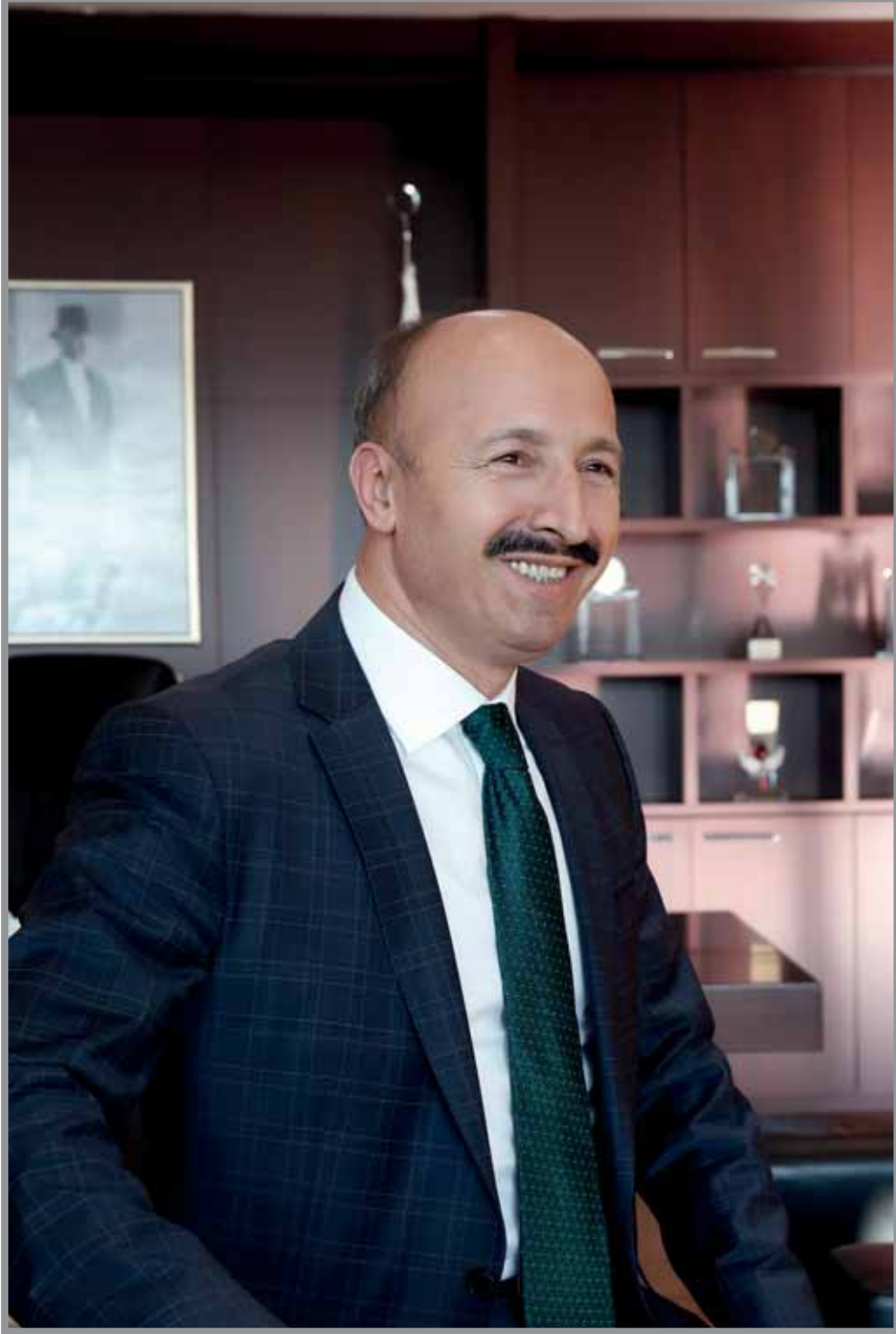
Cahit ALTUNAY Sultangazi Belediye Bařbakanı