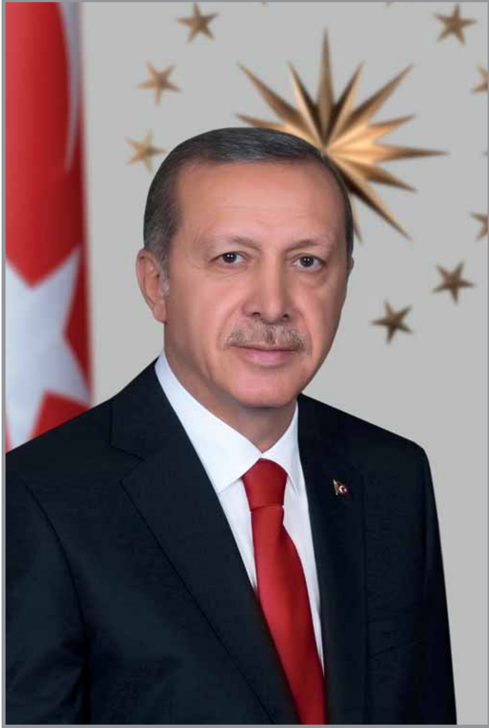
Recep Tayyip ERDOĞAN Türkiye Cumhuriyeti Cumhurbaşkanı