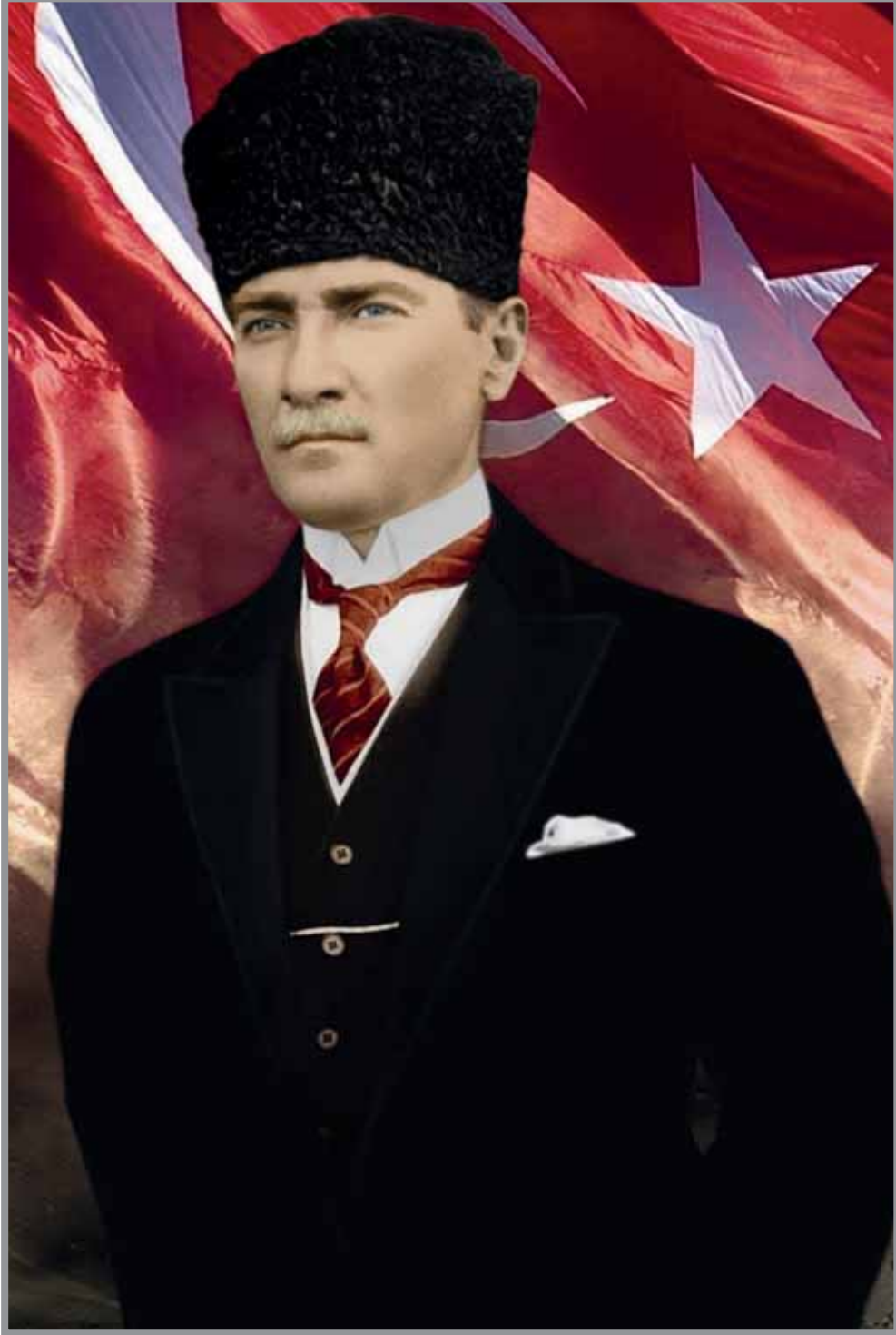
Mustafa Kemal ATATÜRK Türkiye Cumhuriyeti Kurucusu